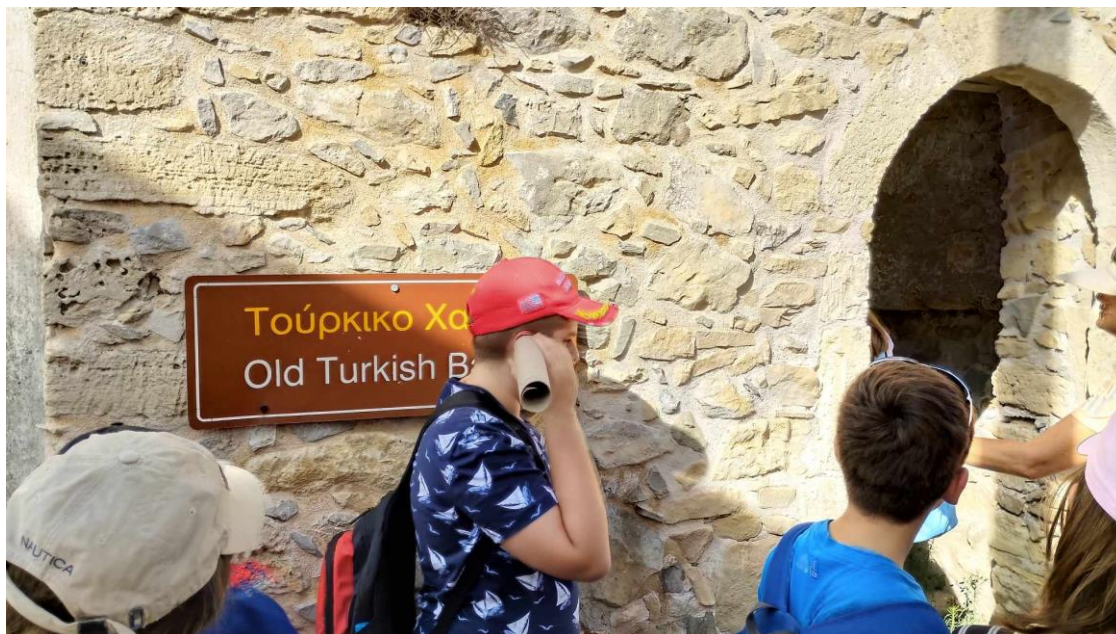
Φωτογραφία 2 Χαμάμ Χανδρά

Στο Μουσείο Φυσικής Ιστορίας και υδροκίνησης του Παγκόσμιου Γεωπάρκου Σητείας στη Ζάκρο έκθεση φωτογραφίας από 26 έως 30 Σεπτεμβρίου με φωτογραφίες που συμμετείχαν στο διαγωνισμό φωτογραφίας του έργου (Παραδοτέο 5.1.1 παρούσας σύμβασης A/A ΥΠΗΡΕΣΙΑΣ 6).