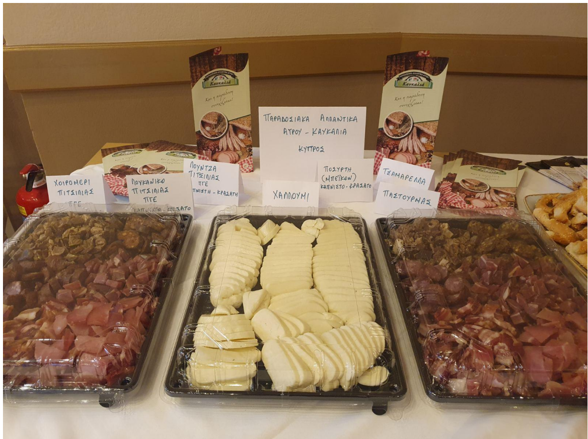
Φωτογραφία 3 Τοπικά προϊόντα Κύπρου-Γευστηγνωσία-Παρουσίαση