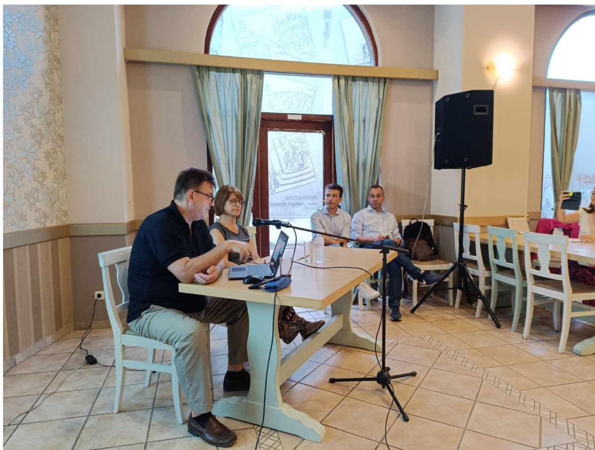
Φωτογραφία 8 Έναρξη Εκδήλωσης Παρουσίαση Εταιρών έργου