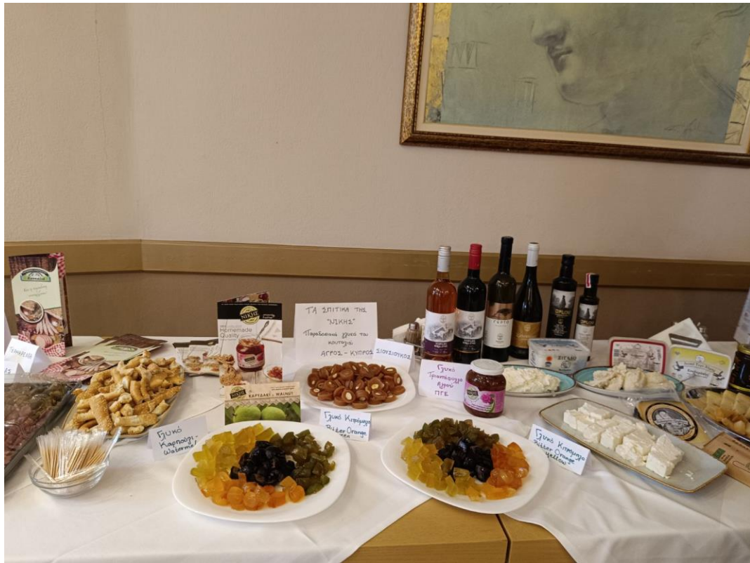
Φωτογραφία 6 Παρουσίαση Τοπικών Προϊόντων Κύπρου