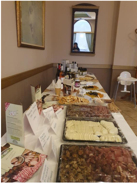
Φωτογραφία. 4 Στήσιμο Παραδοσιακών προϊόντων