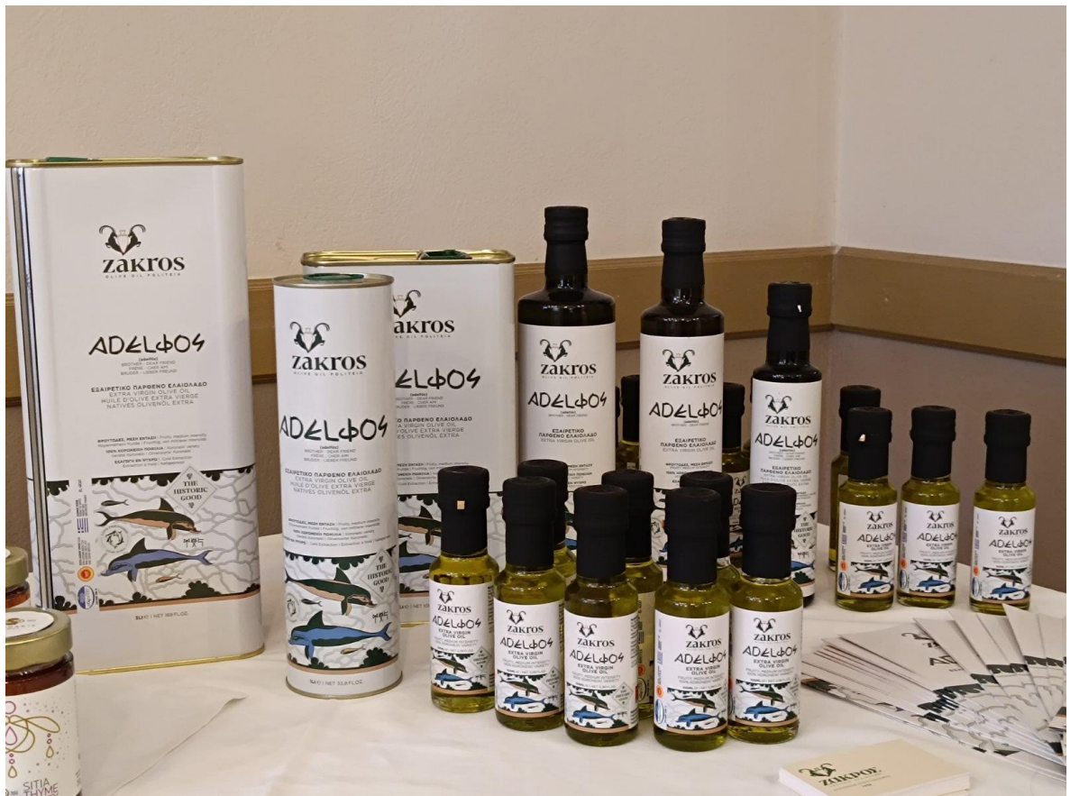
Φωτογραφία. 5 Ελαιόλαδο Ζάκρον Σητεία