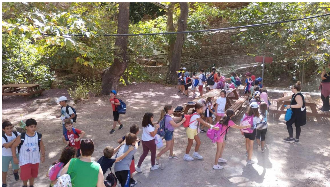
Φωτογραφία 1 Πηγή Ζάκρον