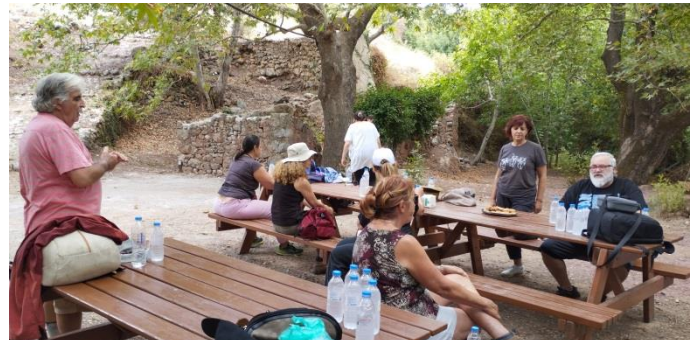
Κέρασμα Πηγή Ζάκρου