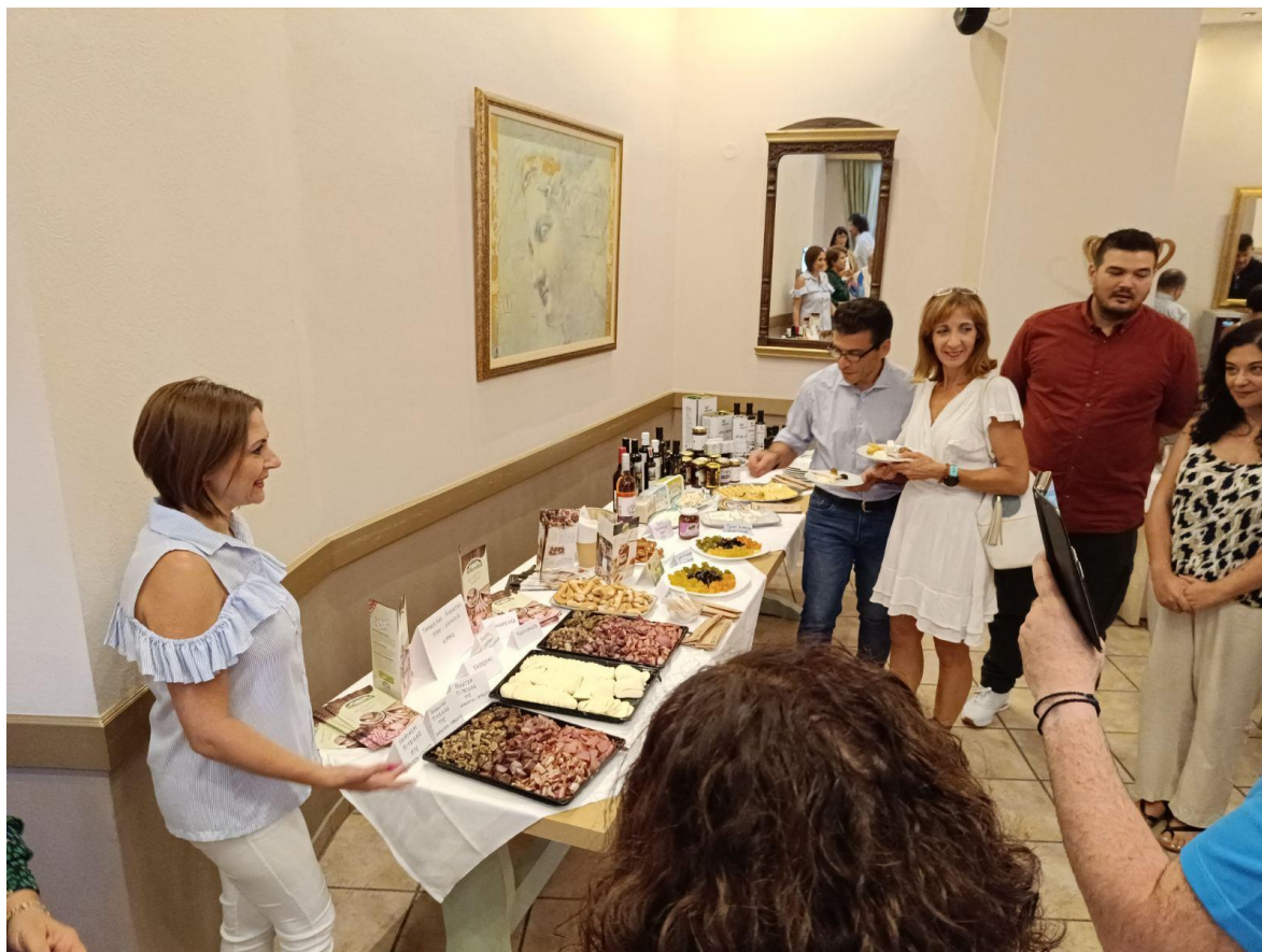
Φωτογραφία 7 Παρουσίαση προϊόντων από την ομάδα της Κύπρου.