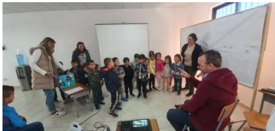
Φωτογραφικό υλικό από την πιλοτική εφαρμογή των εκπαιδευτικών δραστηριοτήτων σε παιδιά προσχολικής ηλικίας.