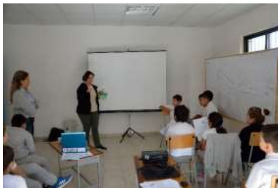
Παρουσίαση της δραστηριότητας A2.2, με το μοντέλο «Ρύπανσης των υπόγειων νερών»