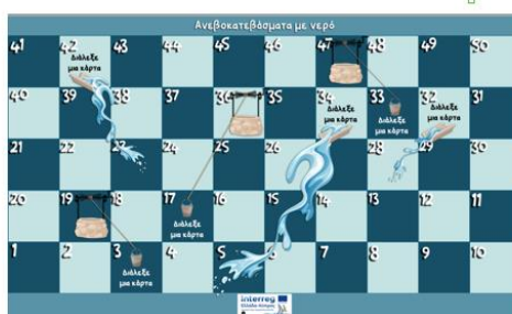
ΕΠΙΤΡΑΠΕΖΙΟ ΠΑΙΧΝΙΔΙ «ΑΝΕΒΟΚΑΤΕΒΑΣΜΑΤΑ ΜΕ ΝΕΡΟ»